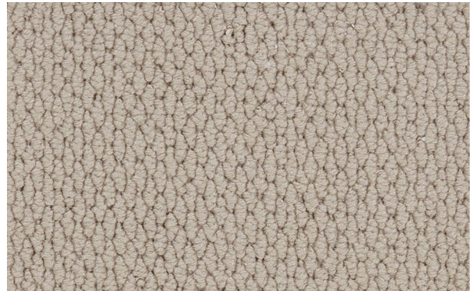
37 4m + 5m