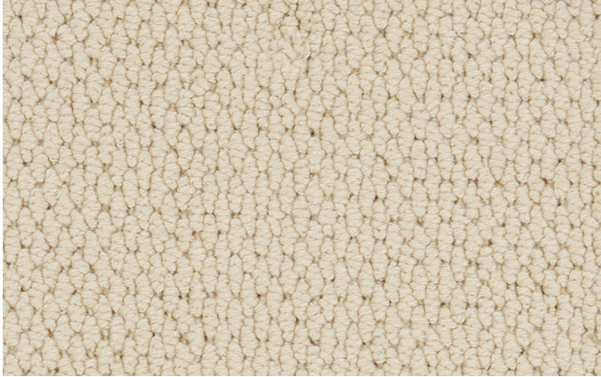
32 4m + 5m