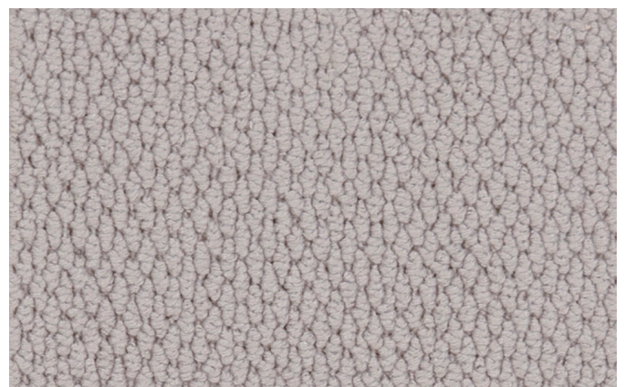
90 4m + 5m

The Associated Weavers Company reserves the right to modify the characteristics of this product while keeping the same technical properties. We strongly recommend the use of darker colours for heavy traffic areas.