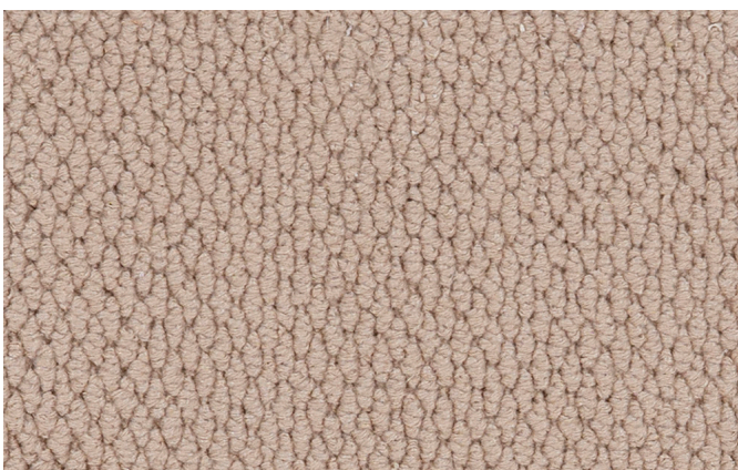
34 4m + 5m