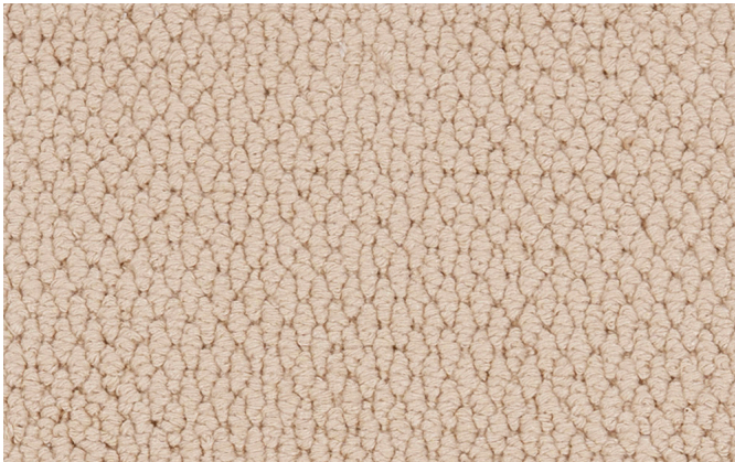
30 4m + 5m