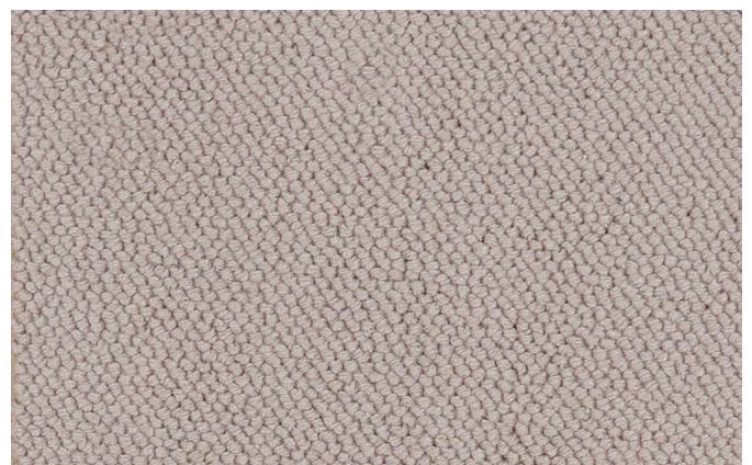
90 4m + 5m

The Associated Weavers Company reserves the right to modify the characteristics of this product while keeping the same technical properties. We strongly recommend the use of darker colours for heavy traffic areas.