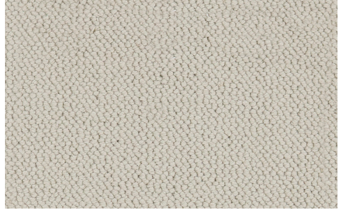
39 4m + 5m