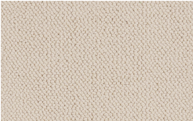
30 4m + 5m