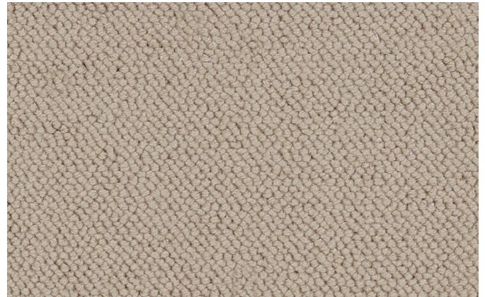
37 4m + 5m