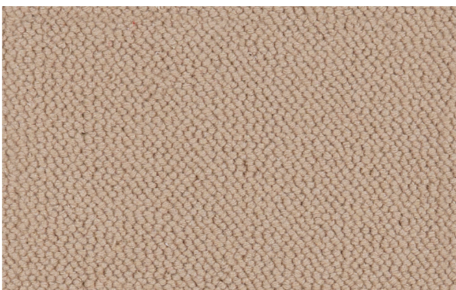
34 4m + 5m